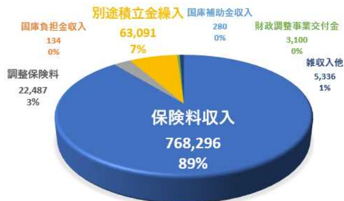
令和5年度決算 収入：1人当り額 (単位：円)